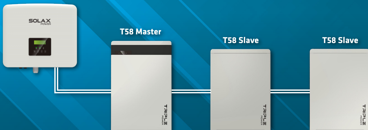
Schéma zapojení T58:

Nejnovější výkonová řada s kapacitou 5,8 kWh v technologii LFP je dalším doplňkem baterií. Triple Power s výbornými vlastnostmi a škálovatelnosti do 23,2 kWh. Oproti předchozích variant zde objednáte Master-baterku včetně BMS jednotky a Slave-baterky zvlášť. Zde neřešíte BMS zvlášť.